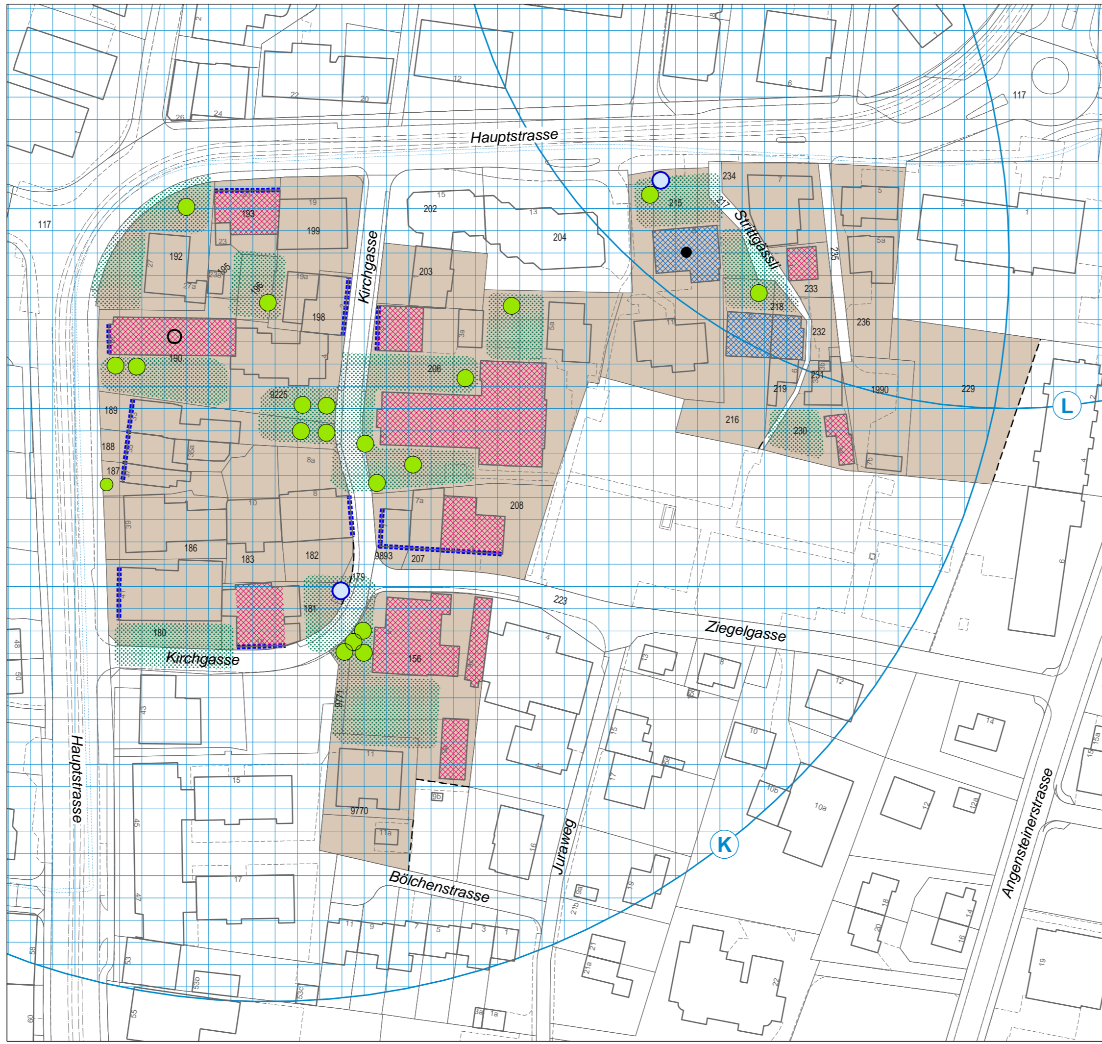
Planfenster Ortskern, Situation 1:1'000